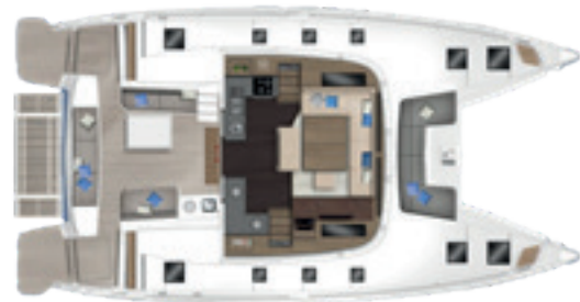
Carré & cockpit / Saloon & cockpit