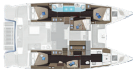
4 cabines, 3 salles d'eau / 4 cabins, 3 heads