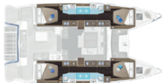
4 cabines, 4 salles d'eau / 4 cabins, 4 heads