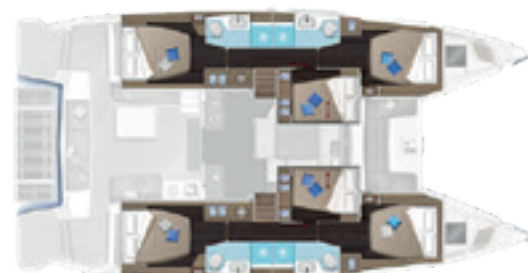
6 cabines, 4 salles d'eau / 6 cabins, 4 heads